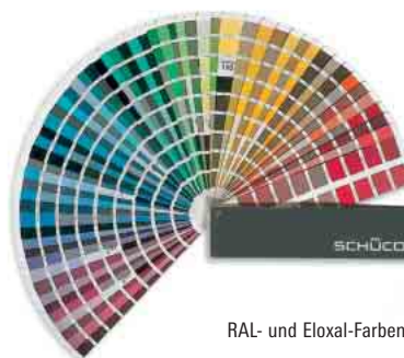
RAL- und Eloxal-Farben