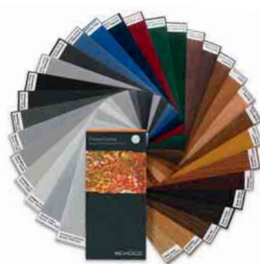
Farb- und Holzdekore